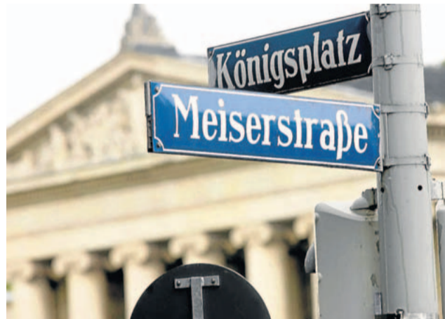
Das Streitobjekt: Die Umbenennung der Meiserstraße ist beschlossen, aber noch nicht vollzogen.