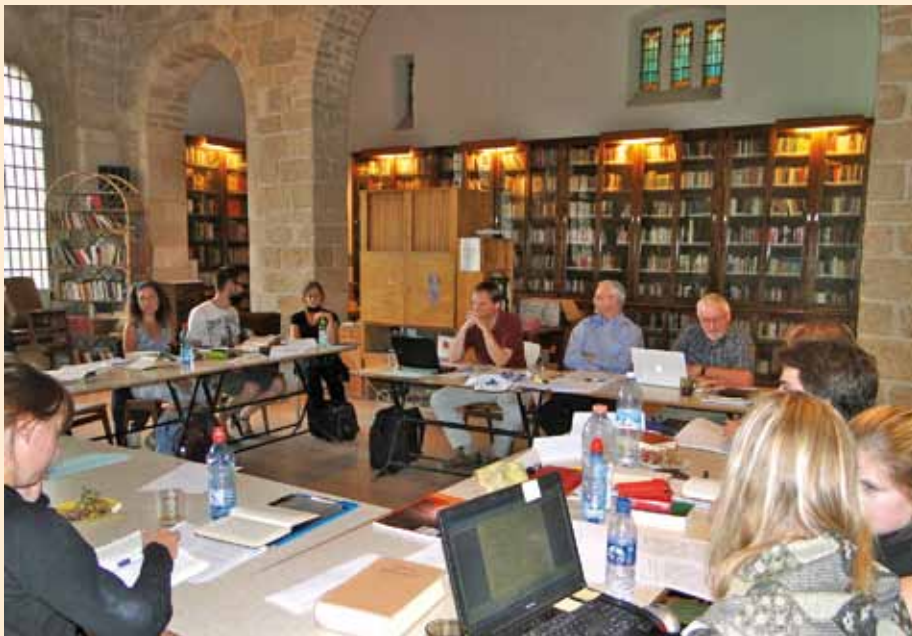
Seminar in der Bibliothek der lutherischen Erlöserkirche in Jerusalem

überleg dir mal, durch welches Handeln Gott bestimmt wird!“ Es ist ein Verweis auf die Befreiung der Israeliten aus Ägypten, durch die sich Gott als der erweisen wird, der er ist. Darauf etwa macht eine synchrone Exegese aufmerksam.