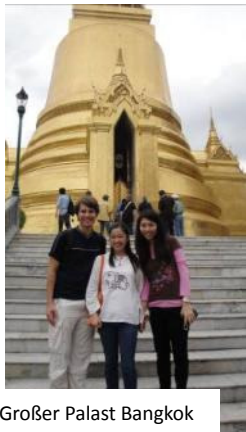
Großer Palast Bangkok

Während meines Besuches bei Kommilitonen in Bangkok und Chiang Mai in Thailand sowie Vientiane in Laos habe ich verschiedene Wege gesehen, die Kirchen gehen können und wie sie in ihrem Umfeld dienen. In Bangkok besuchte ich meine Kommilitonin Noina, die dort in einer Chinesisch-Thais-Presbyterianischen Kirche Pfarrerin ist. Die Kirche betreibt eine große Grundschule und bietet unzählige Sonntagsaktivitäten rund um die Gottesdienst an. In Chiang Mai besuchte ich eine kleine Gemeinde der Church of Christ in Thailand, auch in presbyterianischer Tradition, mit einem Pfarrer in meinem Alter dessen Mentor mein Kommilitone Chaiporn ist. Chaiporn unterrichtet an der theologischen Fakultät der Payap Universität. Diese