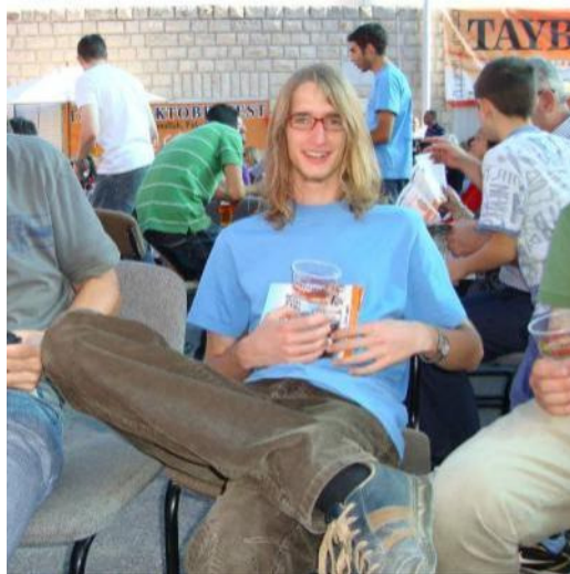
Die ersten Tage in Israel ...

Ansonsten trieb mich mein Weg noch ein wenig in Deutschland umher: über Tübingen nach Berlin und Leipzig, nach Dettelsau (Schlalalalaaaa! Und der Pokal bleibt wieder hieeeeer!!! Schalalalalalalalaaa ...!), nach Stuttgart, Ludwigsburg und Karlsruhe und natürlich ins schöne Hohenlohe, wo die Tage dann doch fast wärmer waren als in Israel ;)