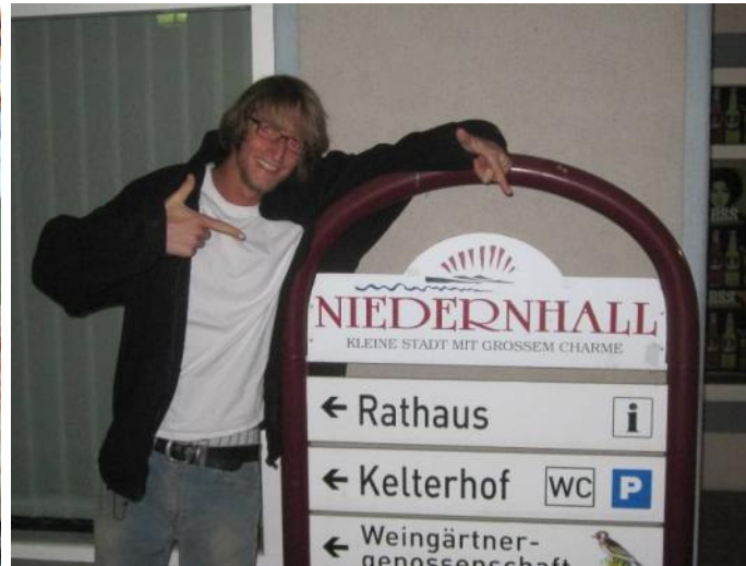
...die ersten Tage in Niedernhall

(man glaubt es ja kaum, aber das ist das einzige Foto, das ich bisher wieder zurück in Deutschland gemacht hab...)