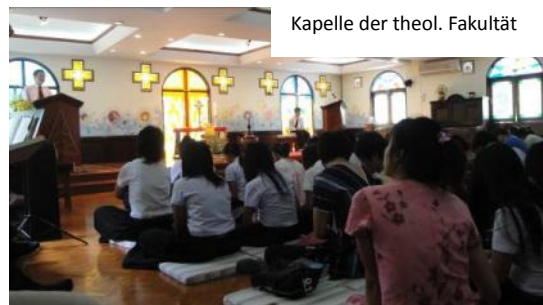
Kapelle der theol. Fakultät

Institution wurde von der Church of Christ ins Leben gerufen und ist mit über 6000 Studierenden die größte christliche Universität des Landes. In der Hauptstadt von Laos, Vientiane, traf ich meinen Zimmermitbewohner sowie andere Freunde und Kommilitonen wieder. Diese arbeiten für die Lao Evangelical Church (LEC), die einzige legale somit