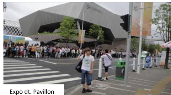
Expo dt. Pavillon

und schließlich nach Schanghai, wo die Metropole mit neuen, architektonischen Meisterleistungen aufwartete und die Expo ihre Pforten auch für uns öffnete. Während unserer Zeit in China legten wir Strecken wie von Barcelona über Göteborg, London, Nizza, Dublin nach Berlin zurückgelegt und konnten so die enorme Größe des Landes erfahren, in dem es