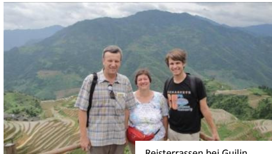
Reisterrassen bei Guilin

Bereits vor dieser Reise hatten mich meine Eltern für eine Woche in Hong Kong besucht. Es hat mir großen Spaß gemacht ihnen 'meine' Stadt zu zeigen und mit ihnen auch noch mal Neues zu